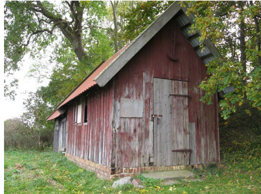
Abb. 2: Niederhof, 2007, Schuppen am Strand.