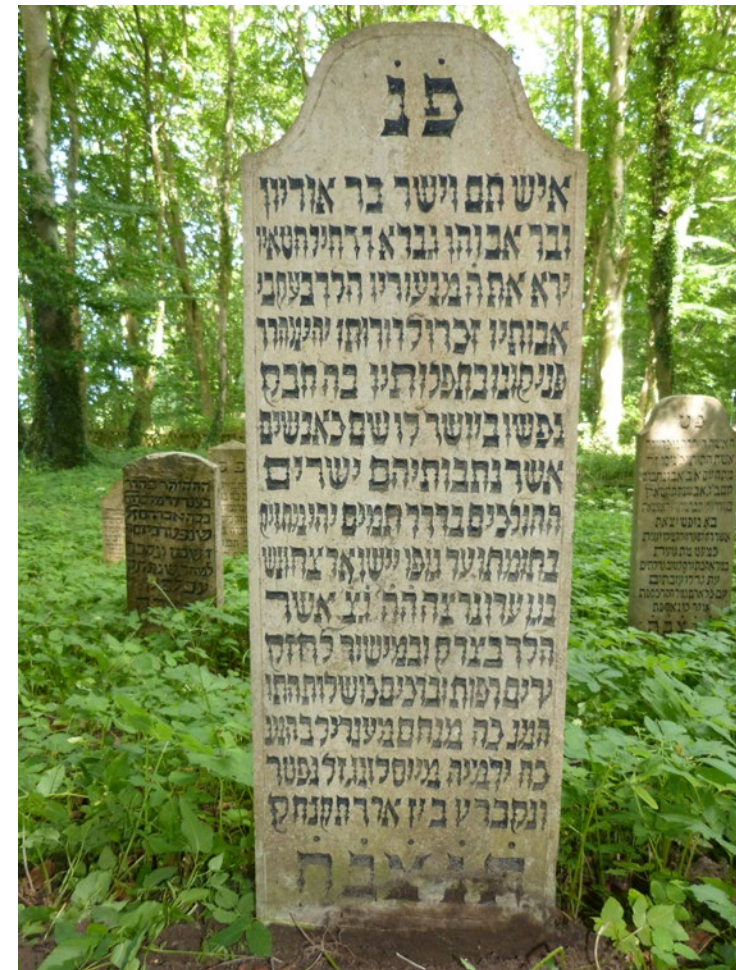
Abb. 5: □ 1102, für Menachem Mendel, Sohn des Jeremia Moisling.

für Menachem Mendel, Sohn des Jeremia Moisling (gest. 1798).