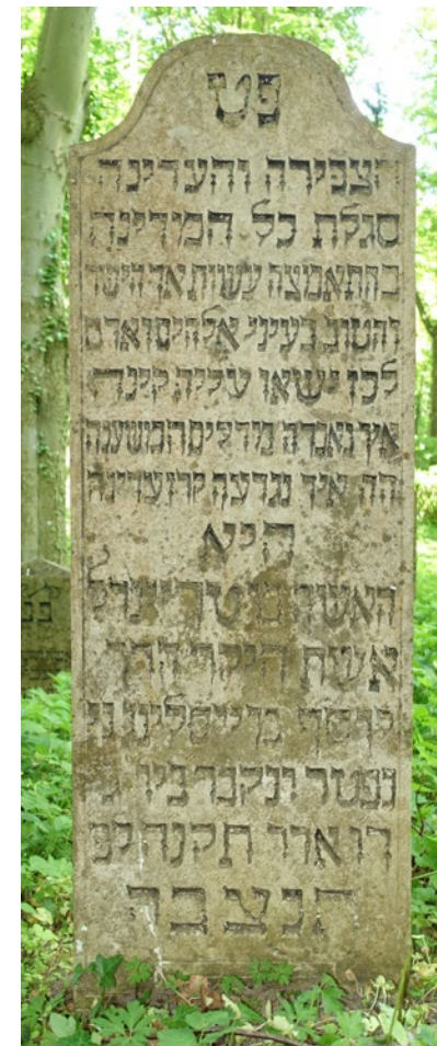
Abb. 7: □ 1104, für Treindel, Ehefrau des Joseph Moising.

Für Treindel, Ehefrau des Joseph Moising (gestorben 1795)