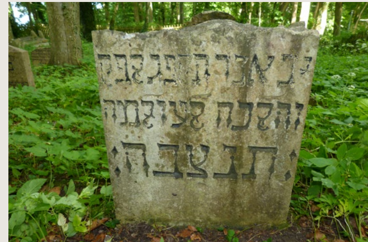
Abb. 6: □ 1103, Bodenfragment, Gedenkstein für eine Frau (gest. 1823),

Grabsteinzählung nach BERNHARDT/TREICHEL, S. 129: Nr. 3?