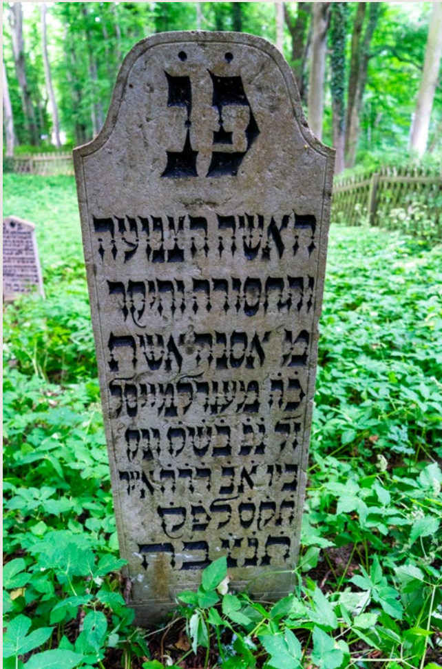
Abb. 4: □ 1101, für Asnah, Ehefrau des Mendel.

Gedenkstein für Asnah, Ehefrau des Mendel (gest. 1800)