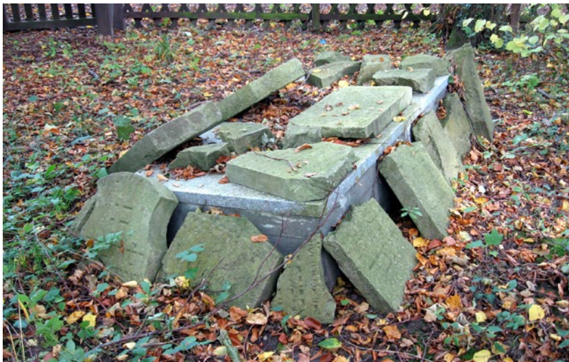
Abb. 1: Niederhof, 2007, Fragmente am Eingang des Friedhofs.